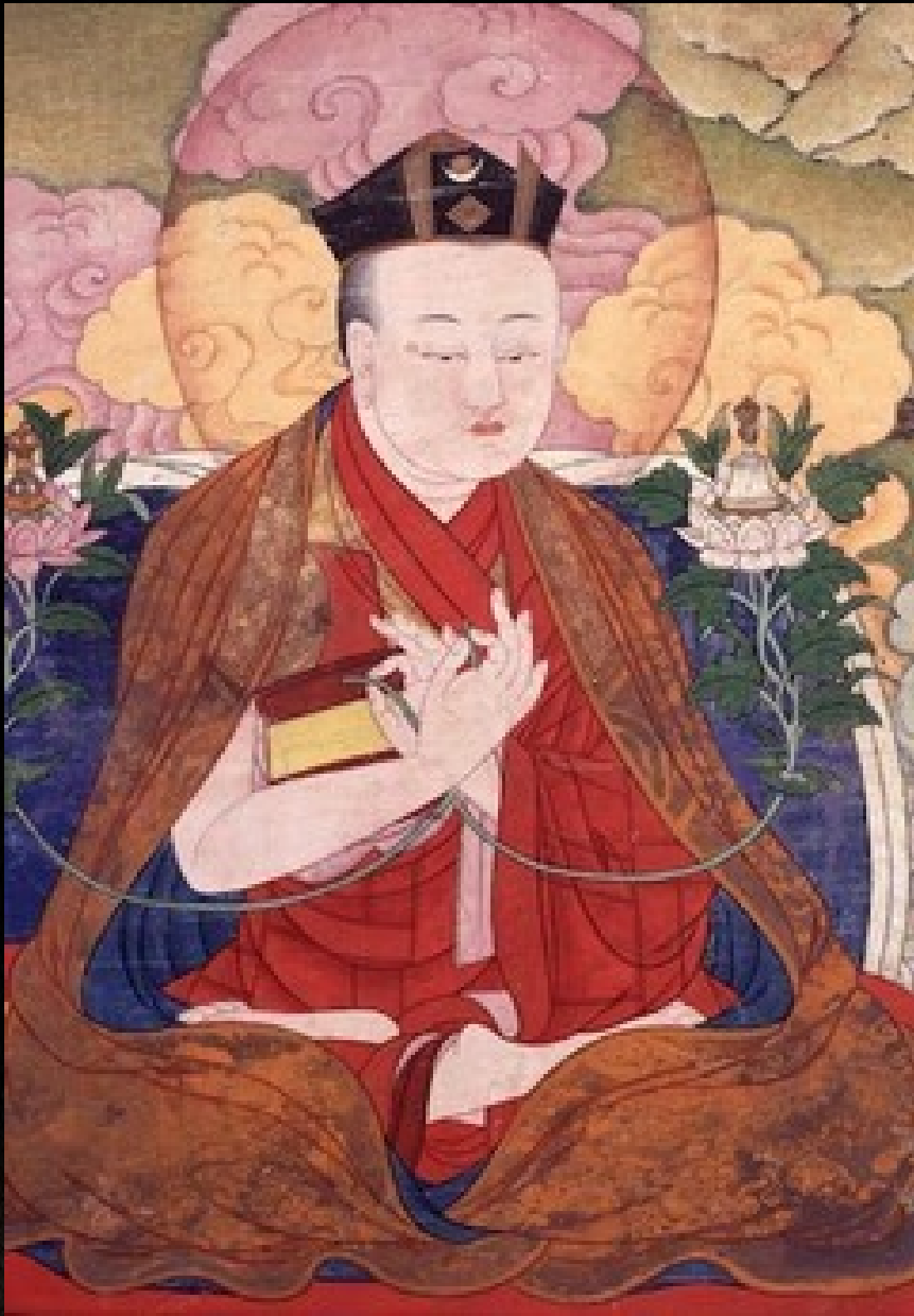
Third Karmapa, Rangjung Dorje