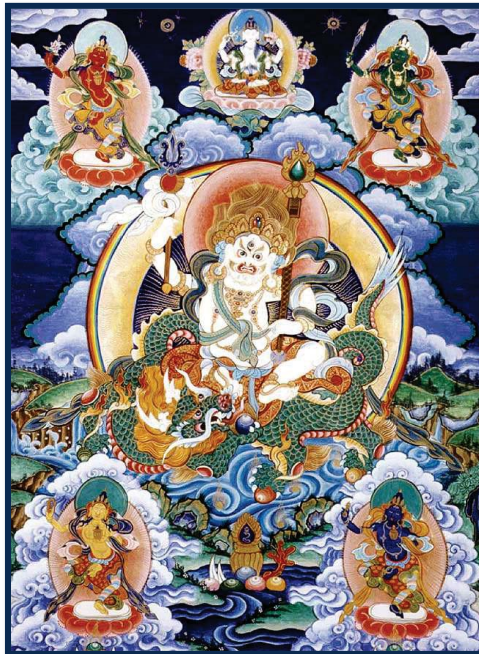
尊聖白財神及四空行母